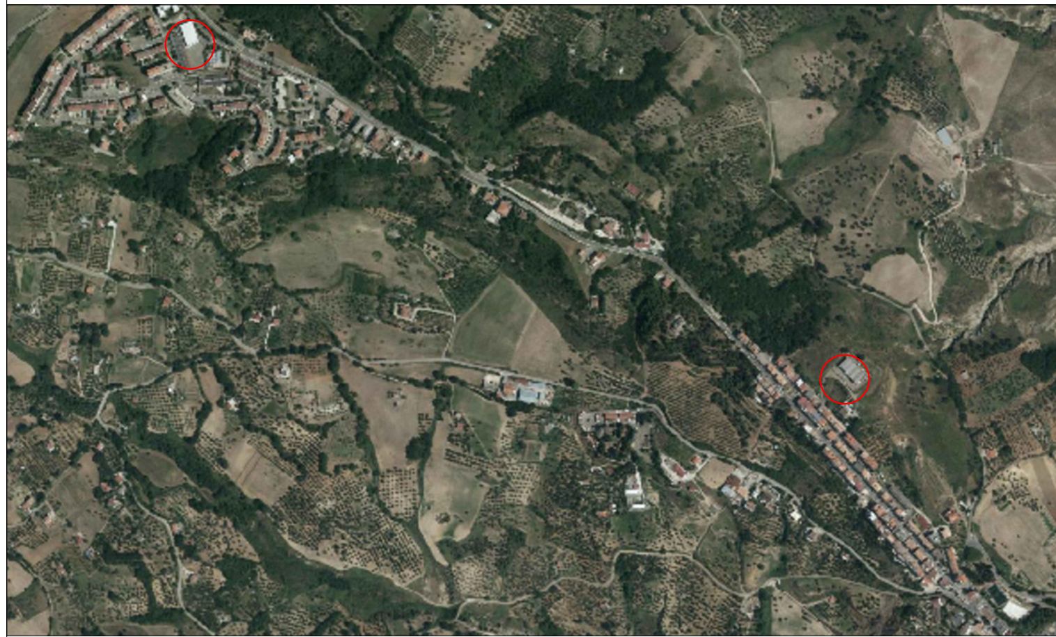
Ortofoto - Scala 1:10'000