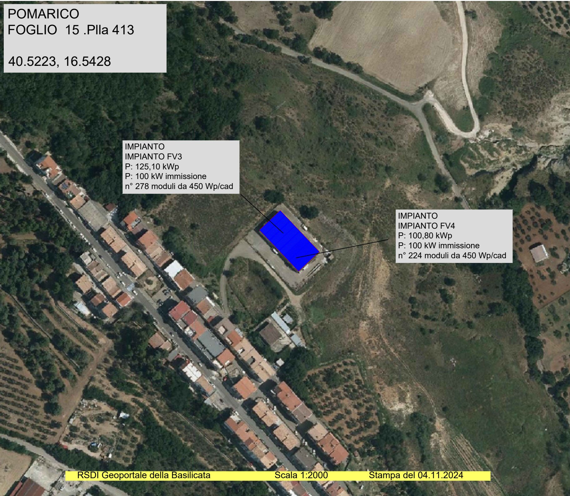
RSDI Geoportale della Basilicata Scala 1:2000 Stampa del 04.11.2024