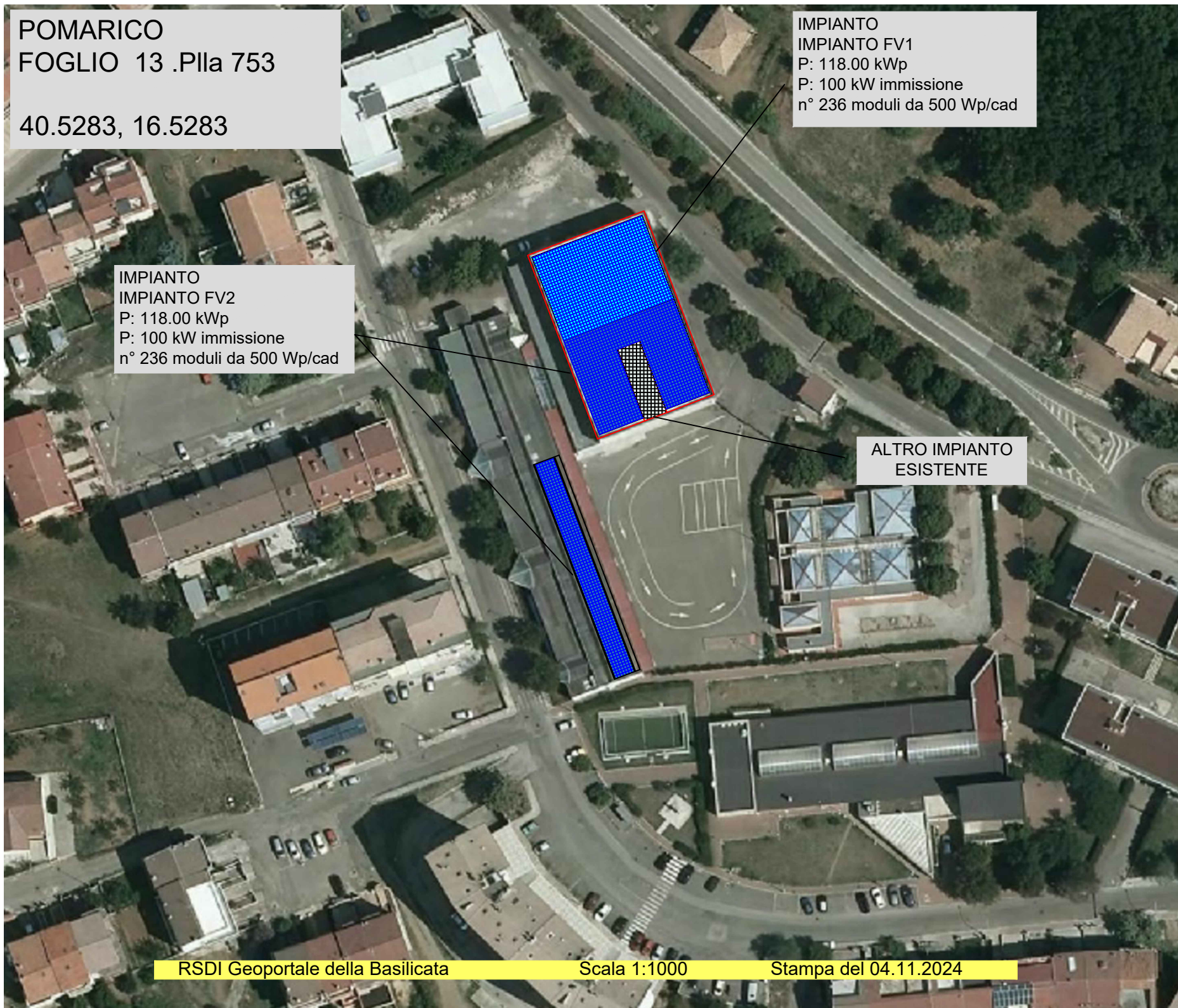
RSDI Geoportale della Basilicata Scala 1:1000 Stampa del 04.11.2024